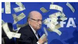
Aktivist gegen Fifa-Chef