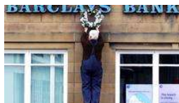
Barclays, Continental AG, JP Morgan